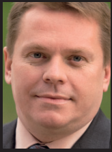
Mini intervju Predsjednik Uprave Indiuma

Sve dok Kina i velik dio svijeta čvrsto vezani uz dolar, njihova potražnja maskirat će njegovu realnu strukturnu slabost